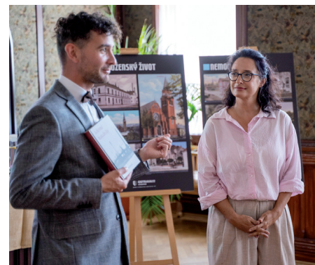
Autorka svou knihu představila na Dni Vítkovic.

Jste renesanční člověk, kromě psaní se věnujete také sklu, pracujete i s jinými materiály. Jak se tyto dvě tvůrčí oblasti doplňují?